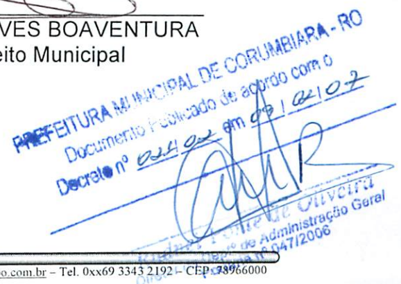
SILVINO ALVES BOAVENTURA Prefeito Municipal